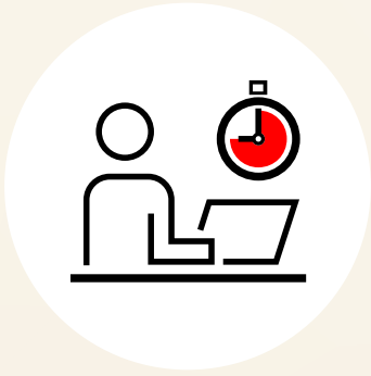
Flexible Arbeitszeit- und Ferienregelung

Bei der Nagra geniesst du eine Fülle von Vorzügen, die sowohl materielle Vorteile als auch Work-Life-Balance ermöglichen.