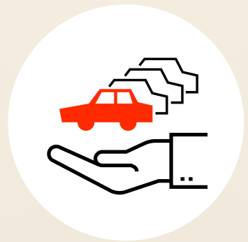
Nutzung des Firmenfuhrparks