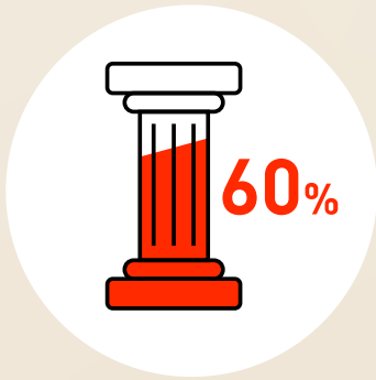
Ausgezeichnete berufliche Vorsorge mit 60 % Arbeitgeber-Anteil