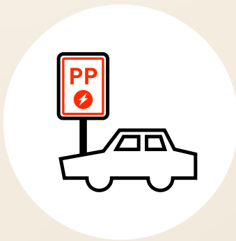
Gratisparkplätze am Arbeitsort mit E-Ladesäulen