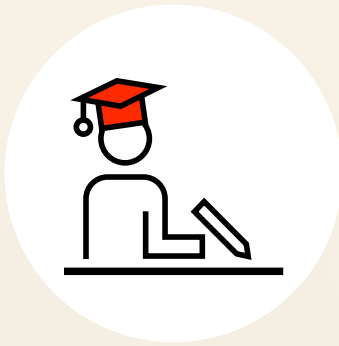
Grosszügige Weiter- bildungsmöglichkeiten