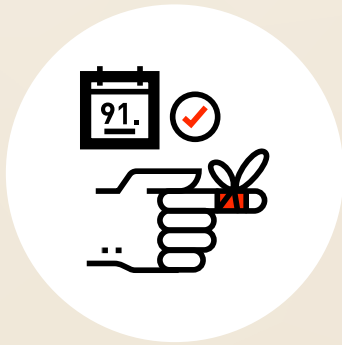
Krankentaggeld- versicherung ab 91. Tag übernimmt Arbeitgeber