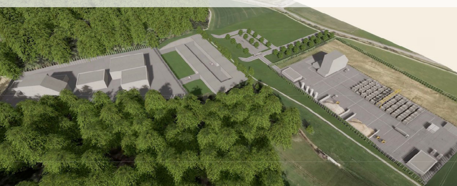
Abbildung 1: Visualisierung der Oberflächenanlage in Stadel Haberstal zum Zeitpunkt ca. 2050.

Der Preis von Immobilien setzt sich grundsätzlich aus vielen verschiedenen preisbildenden Faktoren zusammen. Aspekte wie eine schöne Aussicht auf Gewässer, Berge oder Naturlandschaft, eine gute Anbindung ans Verkehrsnetz oder die Nähe zu Schulen und Einkaufsmöglichkeiten wirken generell preistreibend. Im Gegensatz dazu gehen Lärm und andere Immissionen, Sichtkontakt mit Industriearealen oder eine periphere Lage tendenziell einher mit tieferen Preisen. Diesen nachfrageseitigen Faktoren stehen angebotsseitige Aspekte wie Immobilienbestand, Baulandreserven oder Bautätigkeit gegenüber. In gegenseitiger Wechselwirkung findet im Zuge der Marktmechanismen die Preisbildung statt.