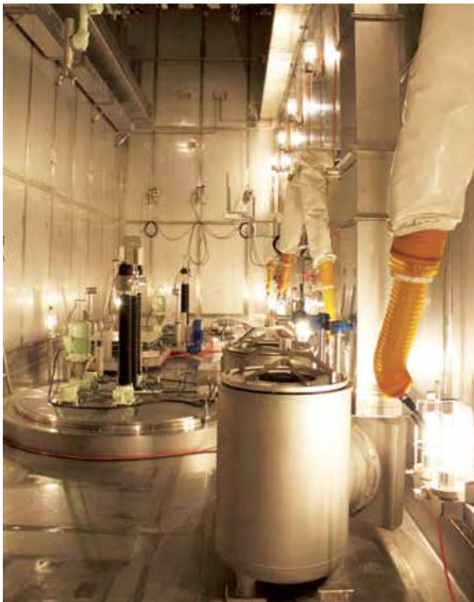
Figur 2: Umladezelle für hochaktive Abfälle der Zwiilag

Aktuell schätzt die Nagra die Realisierbarkeit folgendermassen ein (Stand Mai 2019):